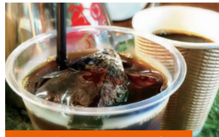
15日(土)・16日(日) 両日出展